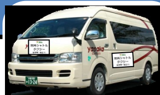
↑ シャトルタクシーのイメージ ※9人乗りジャンボタクシー

◆ 京都マラソン（平成29年2月19日(日)）開催中は、 交通規制等に伴い運休、経路変更する路線バスの代替手段として、 下記の経路・時間において、無料シャトルタクシーを運行いたします。