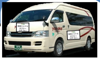
↑ シャトルタクシーのイメージ ※9人乗りジャンボタクシー

◆ 京都マラソン（平成29年2月19日(日)）開催中は、 交通規制等に伴い運休、経路変更する路線バスの代替手段として、 下記の経路・時間において、無料シャトルタクシーを運行いたします。