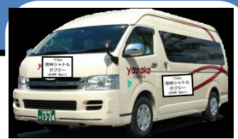
↑ シャトルタクシーのイメージ ※9人乗りジャンボタクシー

◆ 京都マラソン（平成29年2月19日(日)）開催中は、 交通規制等に伴い運休、経路変更する路線バスの代替手段として、 下記の経路・時間において、無料シャトルタクシーを運行いたします。