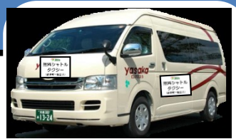
↑ シャトルタクシーのイメージ ※9人乗りジャンボタクシー

◆ 京都マラソン（平成29年2月19日(日)）開催中は、 交通規制等に伴い運休、経路変更する路線バスの代替手段として、 下記の経路・時間において、無料シャトルタクシーを運行いたします。