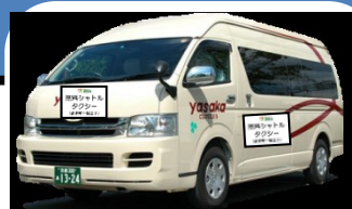
↑ シャトルタクシーのイメージ ※9人乗りジャンボタクシー

◆ 京都マラソン（平成29年2月19日(日)）開催中は、 交通規制等に伴い運休、経路変更する路線バスの代替手段として、 下記の経路・時間において、無料シャトルタクシーを運行いたします。